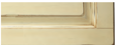
Giallo senape con anticatura noce Yellow mustard finished with walnut shading