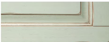
Acqua di mare anticatura noce Sea water finished walnut shading