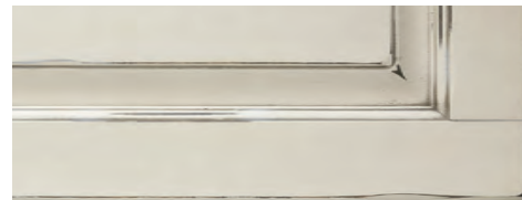
Bianco antico con anticatura nero Old white finished with black shading