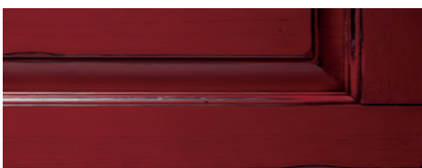
Rosso cina con anticatura nero Red China finished with black shading