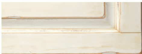
Beige antico con anticatura noce Old beige finished with walnut shading